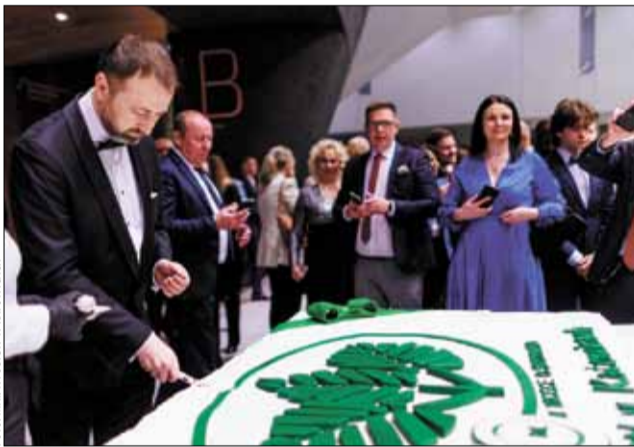
W sali koncertowej katowickiego NOSPR odbyła się jubileuszowa gala 30-lecia Wojewódzkiego Funduszu Ochrony Środowiska i Gospodarki Wodnej w Katowicach, która była świetną okazją do zaprezentowania dotychczasowych działań i osiągnięć.

Działalność powyżej przywołana rozpoczęła się w 1993 roku od niewielkiej instytucji w pierwszych latach funkcjonowania, która na miarę możliwości różnymi projektami wspierała w osiąganiu coraz to lepszych efektów ekologicznych. Nie wszyscy ten wzmożony okres moderni-