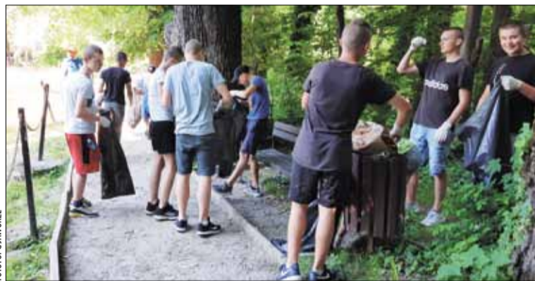
Poprzednie zbiórki śmieci w gminie Jaworze cieszyły się dużym zaangażowaniem ze strony mieszkańców, także licznie przybyłych młodych osób.

Już po raz trzeci wójt Jaworza wraz z tamtejszym Ośrodkiem Promocji Gminy zapraszają na akcję „Wielkie Sprzątanie Jaworza”.