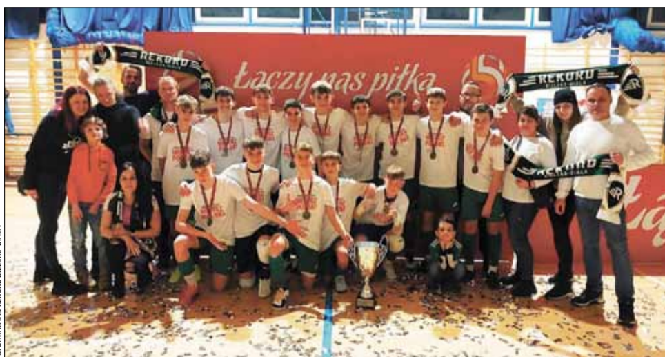
Jednym z ostatnich spektakularnych osiągnięć obecnych uczniów SMS Rekord jest wywalczenie złotych medali Młodzieżowych Mistrzostw Polski w futbolu w kategorii wiekowej do lat 15, co miało miejsce podczas rozegranego końcem ubiegłego roku finału w nadmorskiej Uście.