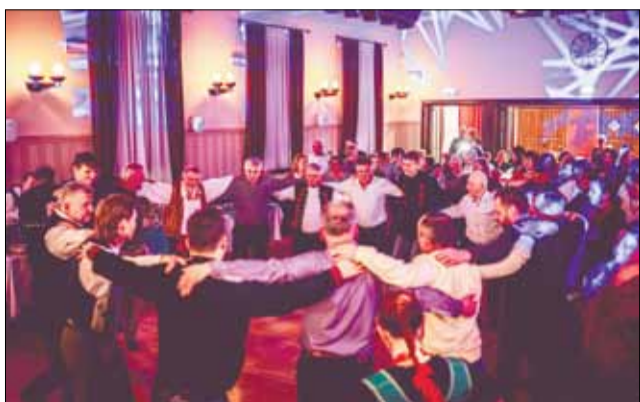
Świąteczną zabawę dla mieszkańców zapewniła pierwsza edycja Integracyjnych Ostatków „Na góralską nutę”. To nowa kulturalna propozycja w gminie Łodygowice.

Bardzo intensywnie upłynęły pierwsze miesiące tegorocznej działalności Gminnego Ośrodka Kultury w Łodygowicach. Zorganizowano wydarzenia mające już swoją historię, ale nie zabrakło też zupełnie nowych inicjatyw, w szczególności obejmujących mieszkańców gminy.