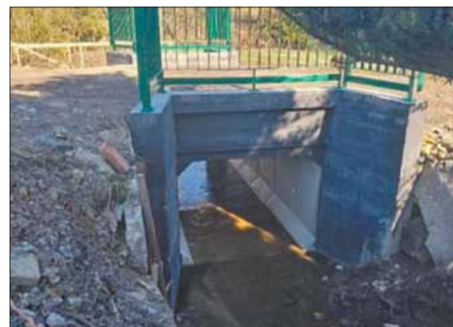
Wyremontowany przepust na ul. Leśnej.

Nie była to pierwsza powódź, która przeszła przez nasze tereny, i nie liczę, żeby była ostatnią. Toteż zaraz po przejściu niszczącej fali powodziowej powołał zespół ds. odbudowy. Nie tyle nawet po to, aby zliczyć straty i znaleźć możliwości sfinansowania naprawy, ale przede wszystkim i skatalogować te działania, które w przyszłości zaowocują zmniejszeniem skali zniszczeń spowodowanych powodzią albo nawet całkowicie zabezpieczą takie niebezpieczne miejsca. Część już udało się wykonać, część będziemy sukcesywnie wprowadzać w miarę naszych możliwości.