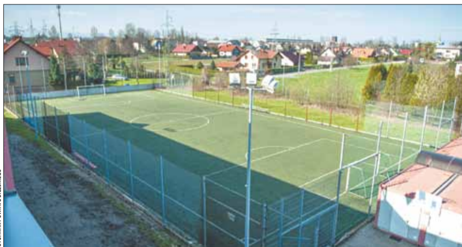
Orlik przy Zespole Szkół Technicznych i Licealnych im. S. Staszica w Czechowicach-Dziedzicach.

Dofinansowanie pozyskano z programu modernizacji kompleksów sportowych „Moje Boisko – ORLIK 2012” – edycja 2025. (MF)