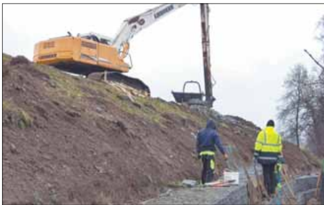
Wały przy ul. Rybackiej zostały wzmocnione.