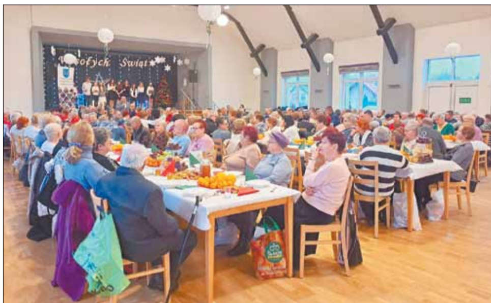
Spotkania różnych środowisk, jak choćby te organizowane w poszczególnych sołectwach z okazji świąt, zawsze cieszą się olbrzymim zainteresowaniem.

nie młodych adeptów futbolu. Na wsparcie liczyć może także Klub Sportowy „Gryf”, a to dlatego, że dyscyplina unihokeja na dobre zdomowała się w Rybarzowicach, znajdując tu sporą grupę zwolenników. Zespoły siatkarskie prowadzi za to z powodzeniem pod swoimi skrzydłami Towarzystwo Społeczno-Kulturalne „Zagroda”.