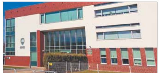
Szkoła Podstawowa i Liceum Ogólnokształcące Mistrzostwa Sportowego BTS Rekord mieszczą się w budynku przy ulicy Startowej w Bielsku-Białej, w sąsiedztwie klubowej bazy.