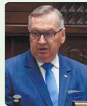
STANISŁAW SZWED, poseł Prawa i Sprawiedliwości:

Jak podkreśla Stanisław Szwed, ta zła sytuacja coraz bardziej dotyka Bielska-Białej i całego regionu, jeszcze niedawno uważanego za świetne miejsce do znalezienia pracy. W drugiej połowie 2024 r. w samym tylko Bielsku pięć dużych zakładów ogłosiło redukcje zatrudnienia o ponad