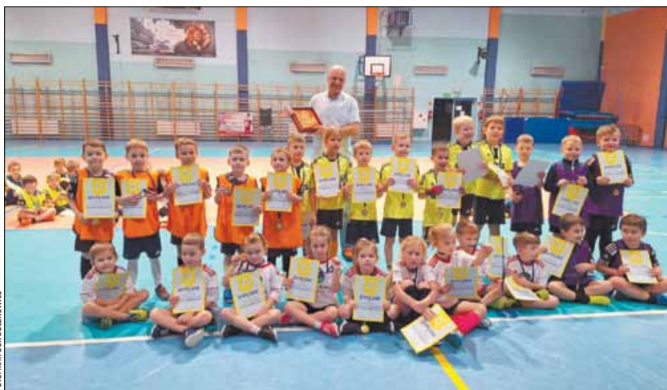
Działalność klubów i stowarzyszeń sportowych efektywnie przekłada się na zaangażowanie dzieci w aktywne spędzanie czasu.

Część konkursów została już rozstrzygnięta, dzięki czemu zainteresowane podmioty mogą bez przeszkód i nieprzerwanie kontynuować działalność. Gmina przyznała przede wszystkim dotacje dla klubów, które w poszczególnych sołectwach dobrze spełniają swoją funkcję. Klub Sportowy „Iskra” Rybarzowice, Ludowy Zespół Sportowy „Beskid Godziszka” oraz Gminny Ludowy Klub Sportowy „Sokół” Buczkowice prowadzą szkolenia w piłce nożnej, które obejmują różne roczniki dzieci i młodzieży, poza tym funkcjonują w nich drużyny seniorów. Klub Sportowy „Halny” w Kalnej obejmuje natomiast aktualnie wyłącz-