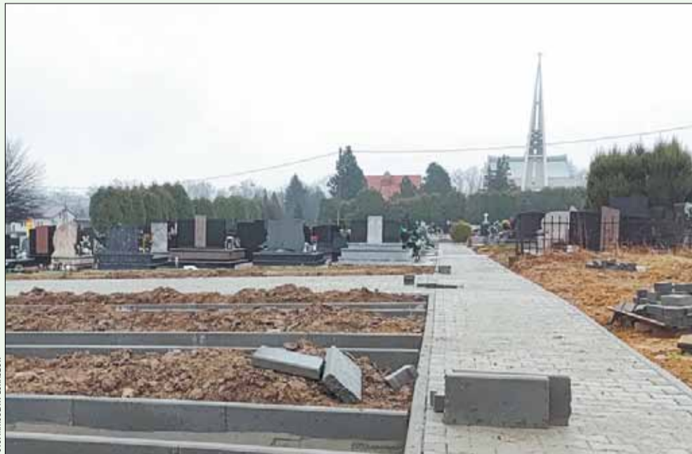
Trwają prace przy rozbudowie cmentarza komunalnego w Pisarzowicach.

To ważna inwestycja, bowiem dzięki rozbudowie powstanie dodatkowych 70 miejsc grzebalnych, których w ostatnich latach wyraźnie zaczęło brakować. Te braki wynikają przede wszystkim z ogromnego rozwoju Pisarzowic. Przypomnę, że w 1990 r. miejscowość liczyła 3,5 tys. mieszkańców, gdy na koniec 2023 r. już