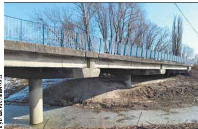
... oraz przy ul. Bielskiej w Ligocie w gminie Czechowice-Dziedzice.

środków powodziowych, które w 80 proc. pozwolą nam na odtworzenie zniszczonej infrastruktury. Do wszystkich przedsięwzięć musimy dołożyć z własnych dochodów te pozostałe 20 proc. oraz pokryć tzw. środki niekwalifikowane, łącznie ponad 6 mln zł. Dobrze jednak, że pieniądze się pojawiły na rozpoczęcie sezonu budowlanego, przygotowujemy przetargi, aby bez zwłoki ruszyć z pracami i zakończyć wszystkie projekty jeszcze przed końcem roku.