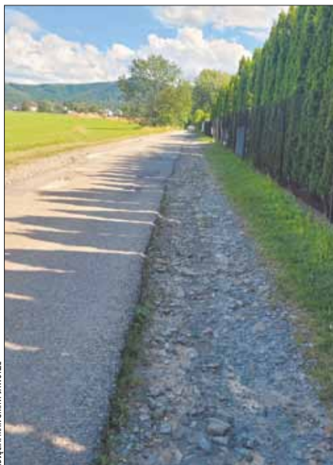
... i Zacisznej.