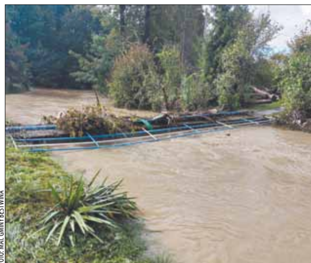
Jedna z kładek zniszczonych w czasie wrześniowej powodzi.