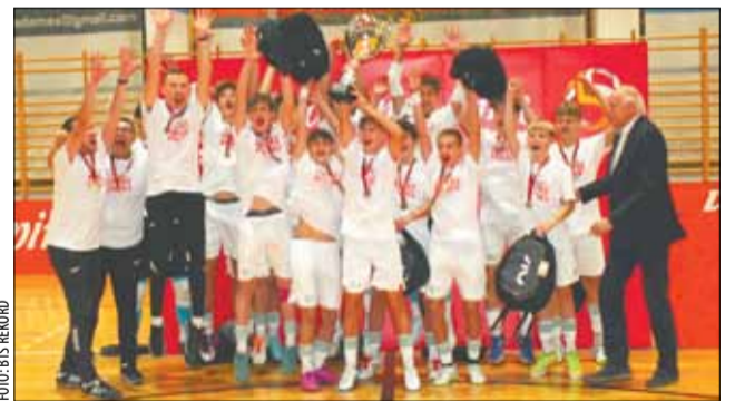
Halowe tytuły mistrzowskie drużyn Rekordu, złożonych z uczniów szkoły, to częsty widok w każdym kolejnym sezonie.