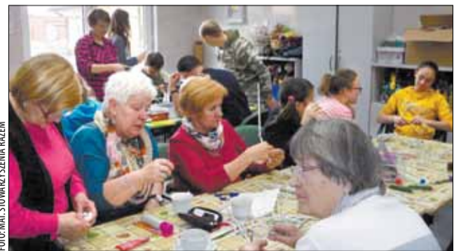
Stowarzyszenie Razem od lat prowadzi działalność integrującą społeczność z różnych grup wiekowych.

Spotkania będą odbywać się w nowym budynku Ośrodka Mieszkalno-Rehabilitacyjnego, prowadzonego przez Stowarzyszenie na Rzecz Osób z Upośledzeniem Umysłowym „Razem” w Bestwinie przy ul. Sikorskiego. Potrwają od marca do grudnia. Są bezpłatne, przeznaczone dla około pół setki seniorów z terenu gminy, osób powyżej 60. roku życia, samotnych, nieaktywnych zawodowo, ale też zainteresowanych różnego rodzaju formami aktywności. Zgłoszenia przyjmuje Gminny Ośrodek Pomocy Społecznej w Bestwinie. (R)