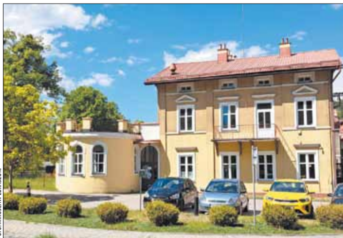
Budynek Pod Goruszką przed adaptacją połączoną z remontem konserwatorskim na potrzeby działalności kulturalnej.

Inwestycja poprawi bezpieczeństwo oraz zmniejszy ryzyko wypadków drogowych. Przebudowa obejmie konstrukcję jezdni wraz z przebudową skrzyżowań