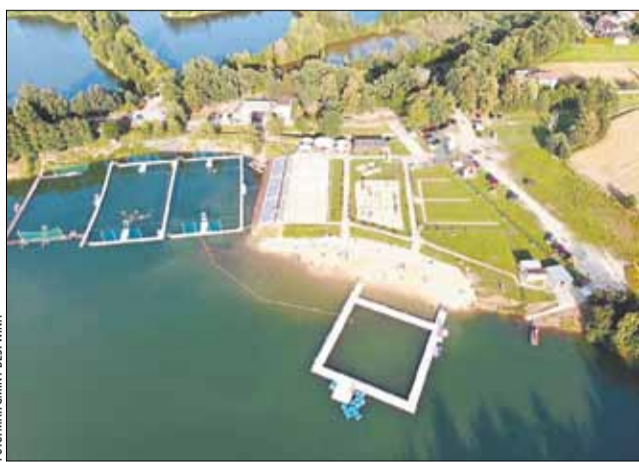
Gminny Ośrodek Rekreacji i Sportów Wodnych w Kaniowie przechodzi modernizację, stworzona zostanie nowa baza dla przeprowadzenia międzynarodowych zawodów kajak polo.

Wójt zapowiada także kontynuację robót związanych z gminną gospodarką wodno-