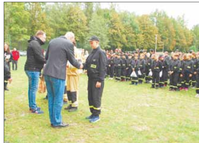
Wsparcie dla jednostek Ochotniczych Straży Pożarnych w oczywisty sposób przekłada się na bezpieczeństwo wszystkich mieszkańców.