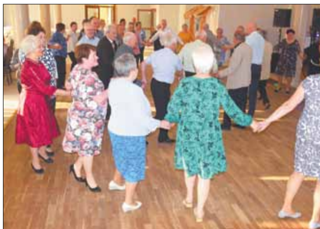
Seniorzy angażują się w życie społeczne, a czas spędzany wśród rówieśników jest w ich przypadku nieocenioną wartością.

Innym rodzajem pomocy ze strony samorządu jest bieżące utrzymywanie obiektów sportowych, co także generuje