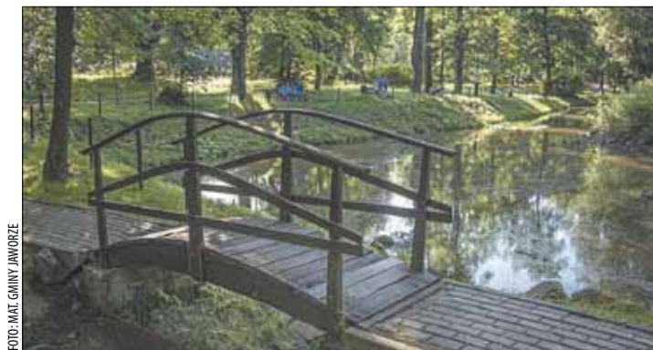
Dla stawu w Parku Zdrojowym przygotowano projekt, który zakłada jego ochronę i regenerację przyrodniczą.

Projekt „Ochrona i regeneracja obszarów cennych przyrodniczo wraz z działaniami edukacyjnymi na obszarze Aglomeracji Beskidzkiej – etap I” jest jednym z flagowych projektów Strategii Zintegrowanego Rozwoju Terytorialnego Aglomeracji Beskidzkiej na lata 2021-2027. Zakłada m.in. renaturyzację stawu wraz z renaturyzacją wyspy jako terenu bytowania ptaków i ptaków, jej zabezpieczenie z utworzeniem