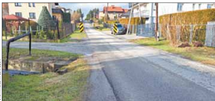
Remont ul. Kwiatowej poprawi bezpieczeństwo poruszania się pieszych i przejazdu samochodów.

z drogami o nawierzchni bitumicznej i poboczami, odwodnienia drogi wraz z wylotami do cieków wodnych.