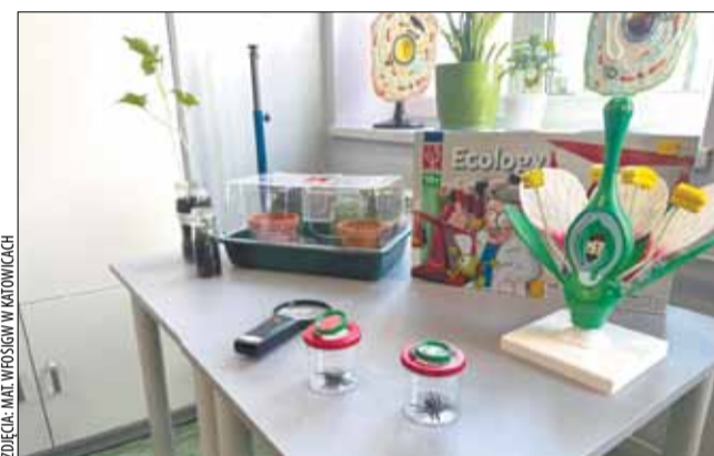
ZDJEŃ: MAT. WFOŚiGW W KATOWICACH

Dobrze wyposażona klasa powstała dzięki dofinansowaniu z ubiegłorocznego konkursu na tworzenie Zielonych Pracowni, organizowanego przez Wojewódzki Fundusz Ochrony Środowiska i Gospodarki Wodnej w Katowicach. – Jestem niezmiernie dumny, że mogę być częścią tego wyjątkowego momentu, w którym dzieci w Brzuśniku zyskują przestrzeń, w której będą mogły pogłębiać swoją wiedzę o naturze i ochronie środowiska