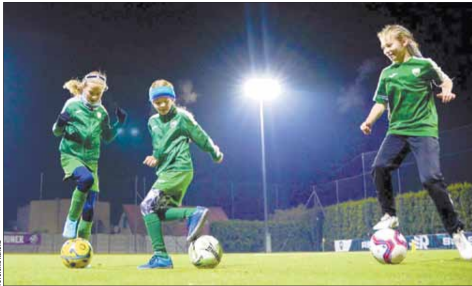
Profesjonalne szkolenie piłkarskie, w oparciu o obiekty Centrum Sportu Rekord, obejmują zarówno dziewczęta, jak i chłopców.

Egzamin maturalny z matematyki zdany na poziomie 65 procent, przy czym jedna z klas osiągnęła imponujący wskaźnik 72 proc., ósmoklasiści „wykręcili” natomiast blisko 60 proc. na zwieńczenie nauki w szkole podstawowej. Liczby te, przewyższające średnie w województwie śląskim i w skali ogólnopolskiej, wymownie pokazują, że w SMS Rekord edukacja nie jest na dalszym planie. Nieobecności w szkole,