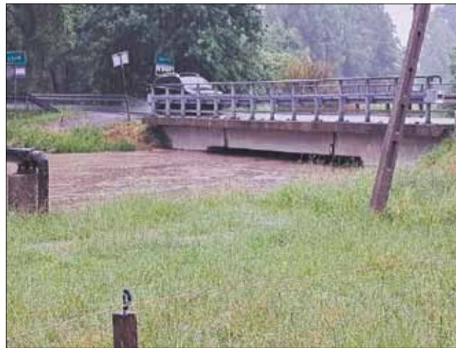
Zniszczone przez powódź mosty przy ul. Zabrzskiej...