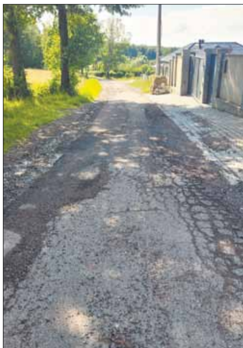
Zniszczenia w wyniku powodzi na ul. Panoramicznej ...

Blisko 2,2 mln zł otrzymało Jaworze na naprawę dróg zniszczonych podczas pierwszej z dwóch ubiegłorocznych powodzi. Wkrótce rozpoczną się prace.