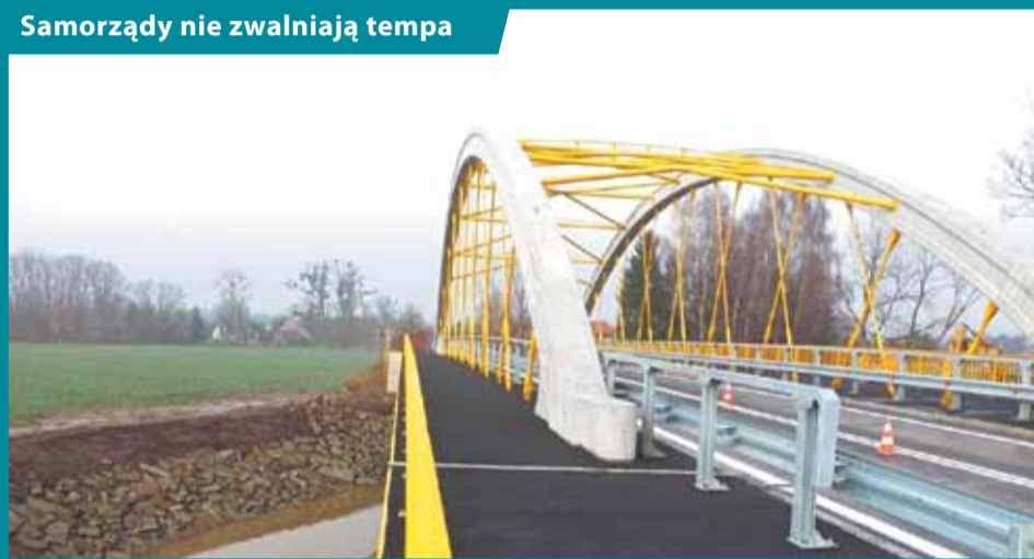
Samorządy nie zwalniają tempa