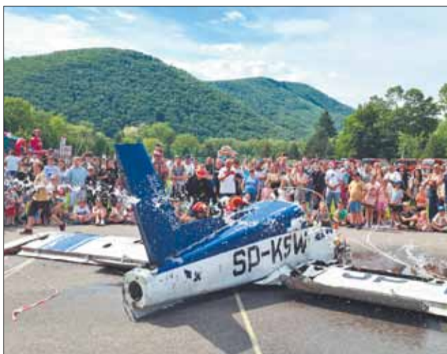
Wydarzeniom organizowanym na terenie gminy Porąbka towarzyszą każdorazowo atrakcje, które przykuwają uwagę całych rodzin.

Czerwcowego Święta Gminy Porąbka przegapić nie można. Wszystko rozpocznie się na stadionie LKS Zapora w Porąbce w piątek 19 czerwca od kina plenerowego w przyjemnej atmosferze, na leżakach i pod gołym niebem z filmowym seansem. Nazajutrz, w sobotę 20 czerwca wystąpi Kamil Bednarek z zespołem