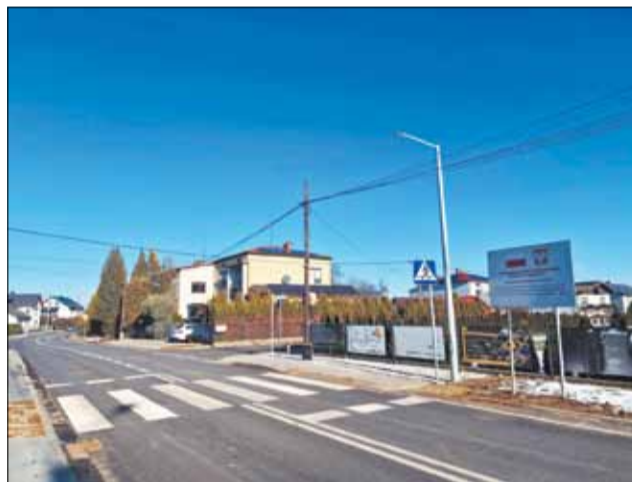
Przebudowana ulica Sikorskiego w Zabrzegu.