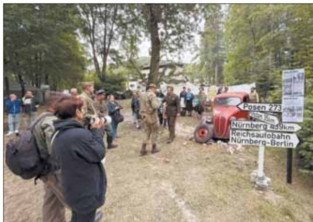
Co roku na kilka dni Porąbka zamienia się w miejsce rekonstrukcji w trakcie imprezy „Historie Frontowe” jako największego militarne wydarzenia w Polsce.

Pełny kalendarz, uwzględniający wiele innych ciekawych imprez w gminie Porąbka na przestrzeni 2026 roku, dostępny na stronie internetowej www.porabka.pl .