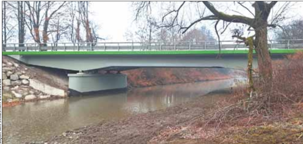
Nowy most na ulicy Bestwińskiej na granicy Czechowic-Dziedzic i Bestwiny.

W podobnym czasie oddano do użytku inny ważny most – w Ligocie, nową konstrukcję wybudowaną po powodzi w 2024 r. W wyniku powodzi w czerwcu i wrześniu 2024 r. okoliczne pola były całkowi-