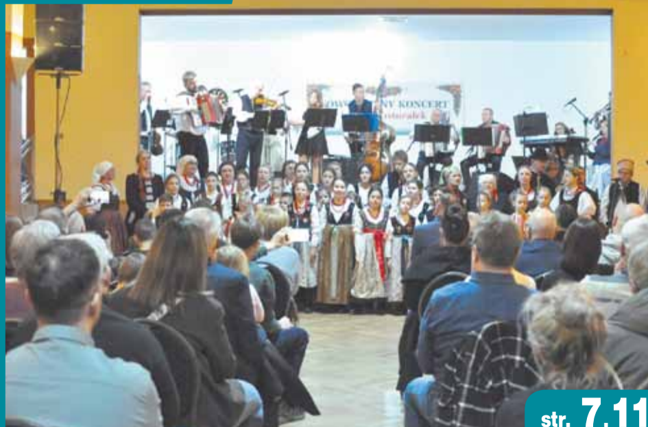
Koncerty i jasełka