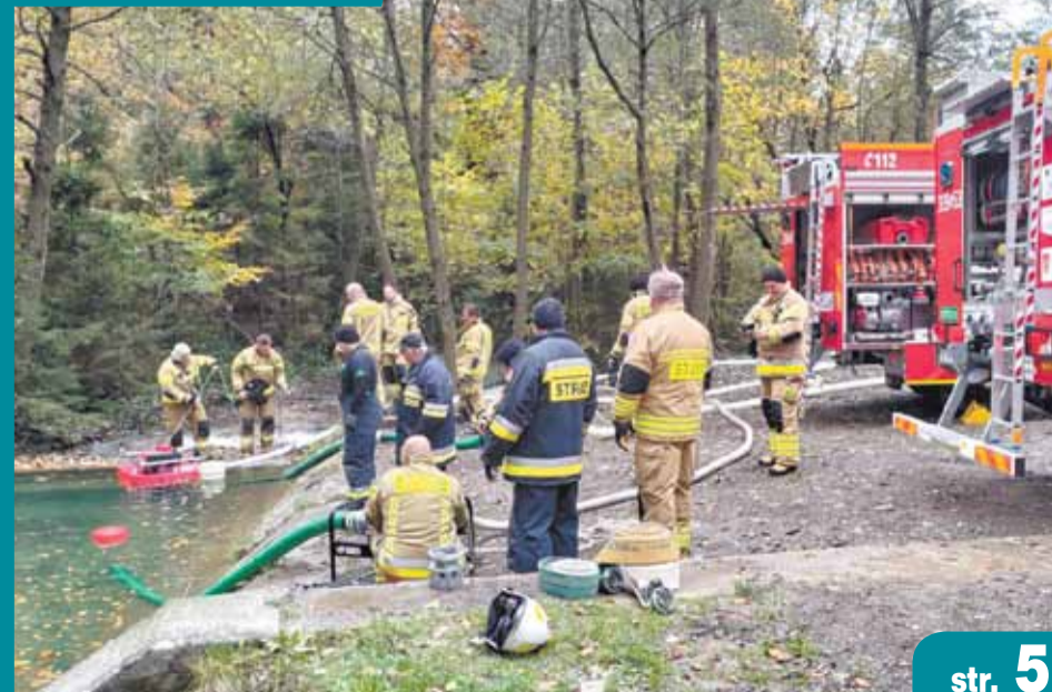
Fundusze na sprzęt