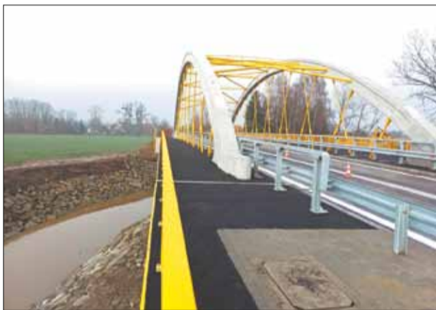
Nowy most w Ligocie ma konstrukcję, która zdoła się oprzeć dużym powodziom.

Całkowity koszt inwestycji wyniósł około 7 mln zł. Powiat Bielski pozyskał 80 proc. dofinansowania z budżetu państwa w ramach środków na odbudowę po powodzi, a pozostała kwota została pokryta z budżetu Powiatu. Prace zrealizowano w imponującym tempie, bo w ciągu zaledwie sześciu miesięcy.