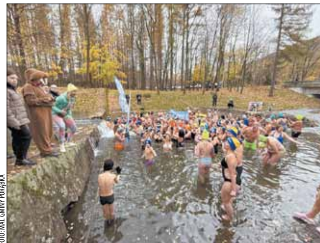
Na 19 kwietnia w kalendarzu przewidziano oficjalny finał sezonu morsowego, który aktualnie trwa w najlepsze.