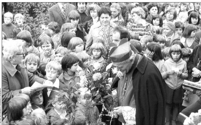
Na wystawie zaprezentowano wiele unikatowych fotografii kardynała Wojtyły.

Do 22 lutego w Galerii Sfera można obejrzeć wystawę „Był wśród nas”, prezentującą archiwalne zdjęcia, animacje i unikatowe materiały filmowe, dokumentujące pobyt na Podbeskidziu Karola Wojtyły – najpierw jako chłopca, potem księdza, biskupa, kardynała, w końcu papieża.