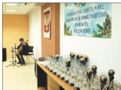
Wręczeniu nagród towarzyszył występ młodych muzyków.