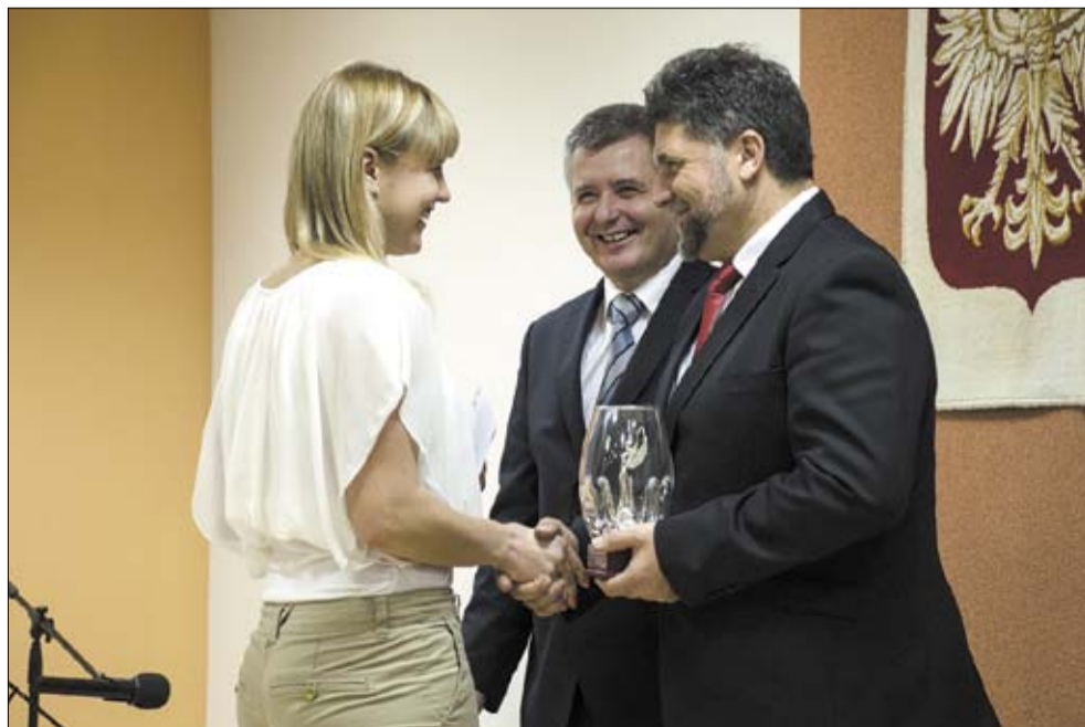
W klasyfikacji klubów powiatowych UKS Set Kaniów z sekcją kajak-polo znalazł się w ścisłej czołówce.