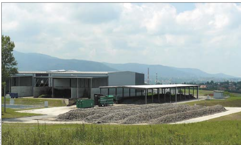
Kompostownia bielskiego ZGO z placem do przewracania pryzm.

Do doraźnych przedsięwzięć, jakie ZGO podjął, aby ograniczyć uciążliwe zapachy, zgłaszane przez mieszkańców, należy zaliczyć dezodoryzację w trakcie przygotowania wsadu