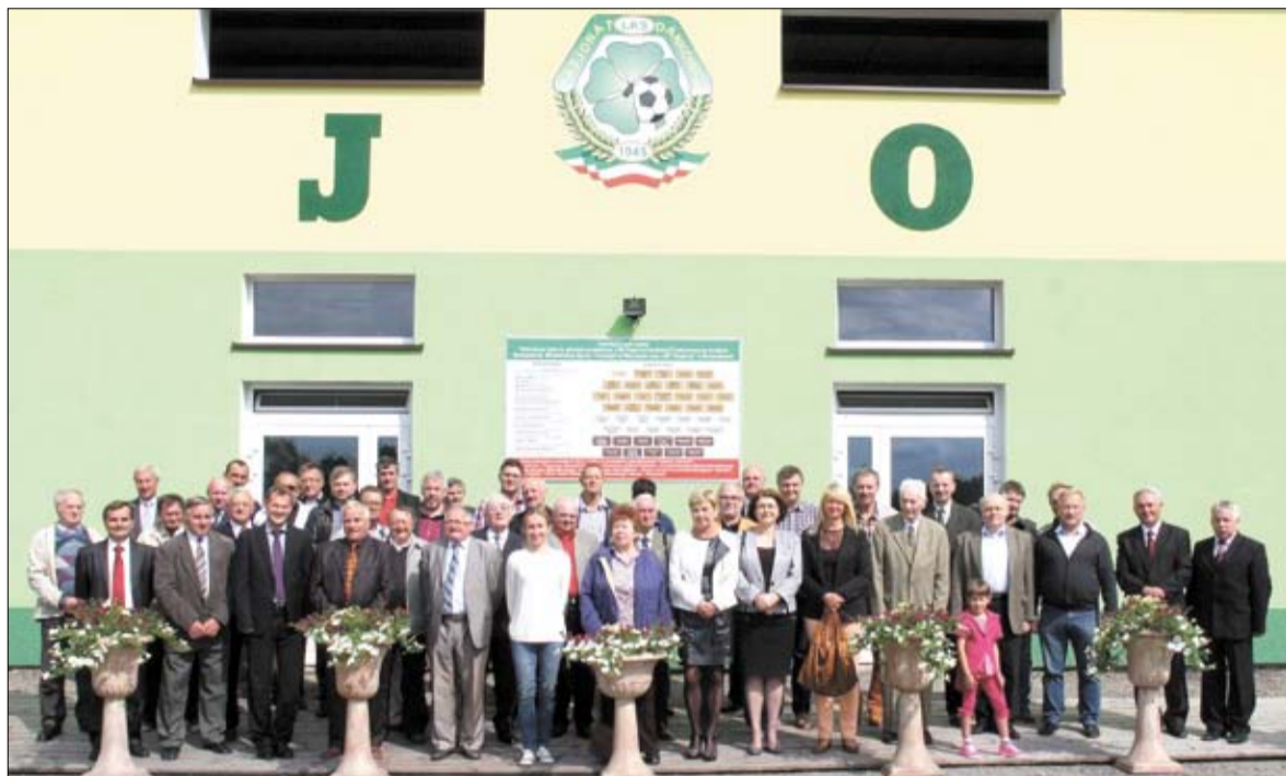
Na przestrzeni minionych 70 lat klubu z Dankowic wiele osób przyczyniło się do rozwoju i sukcesów Pasjonata.

Jedno z sołectw gminy Wilamowice stało się znane na cały kraj w latach 90. minionego wieku. Wówczas to piłkarska drużyna seniorów LKS Pasjonat wywalczyła awans do IV ligi, by następnie zanotować jednoroczny pobyt szczybel rozgrywkowy wyżej. Łącznie aż 12 lat klub z Dankowic występował powyżej klasy okręgowej. – Każdemu klubowi życzyłbym przeżycia tak wspaniałych lat, zwłaszcza, że nie mieliśmy nigdy w Dankowicach możliwych sponsorów, którzy gwarantowałyby okazały budżet Pasjonata. Po latach cieszymy się z tego, co było.