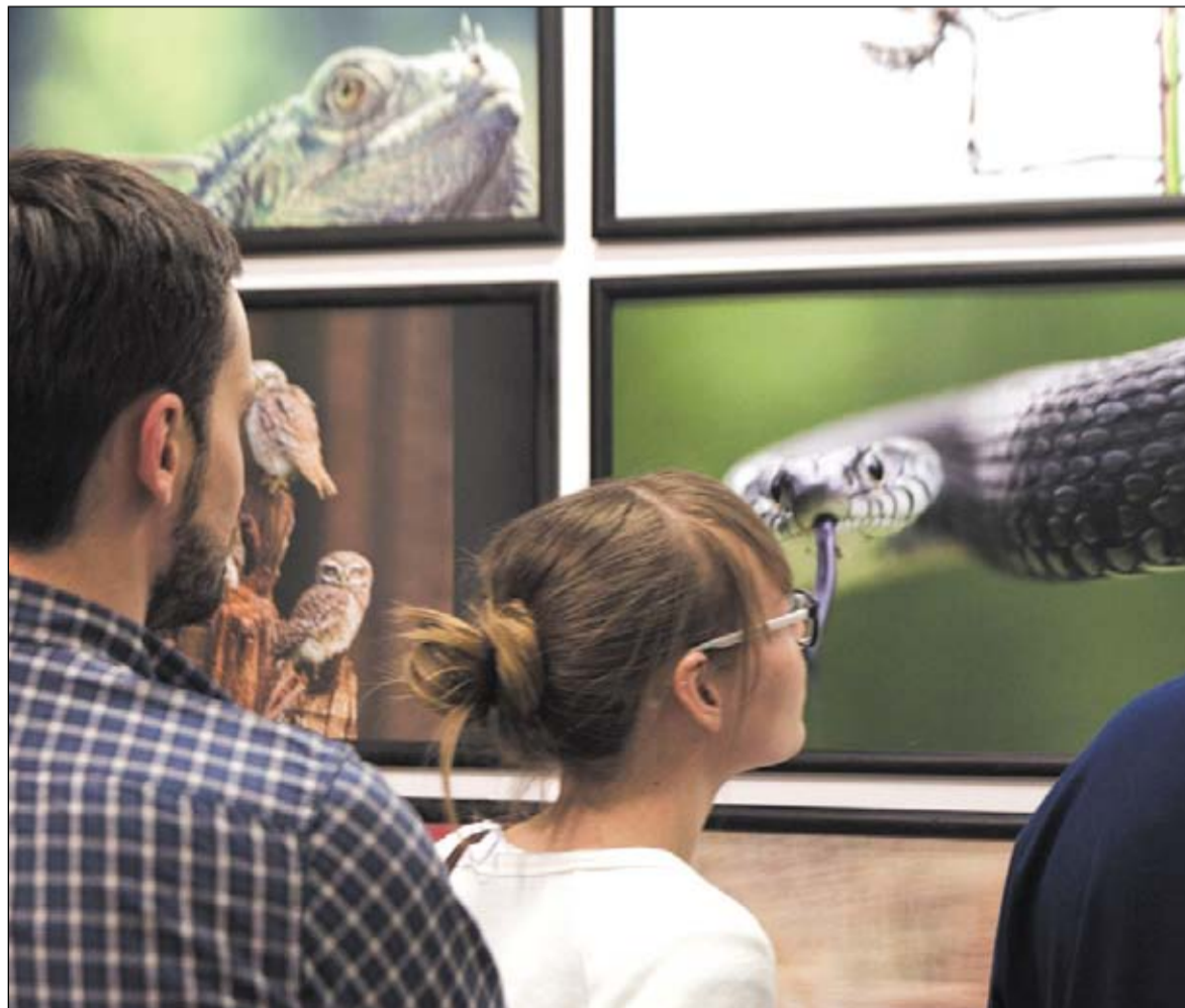
Od lat wystaw fotografii dzikiej przyrody przyciągają tłumy widzów.

Z wystawianych zdjęć emanuje piękno i różnorodność przyrody, zadziwiający zachowania zwierząt i zjawiska przyrodnicze, wzbudzają podziw ujęcia fotograficzne natury, wykonane przez fotografów w nieprawdopodobnych często sytuacjach. Z niektórych ujęć bije groza, gdy dokumentują destrukcyjną działalność człowieka i dewastację środowiska naturalnego. Intrygujące są