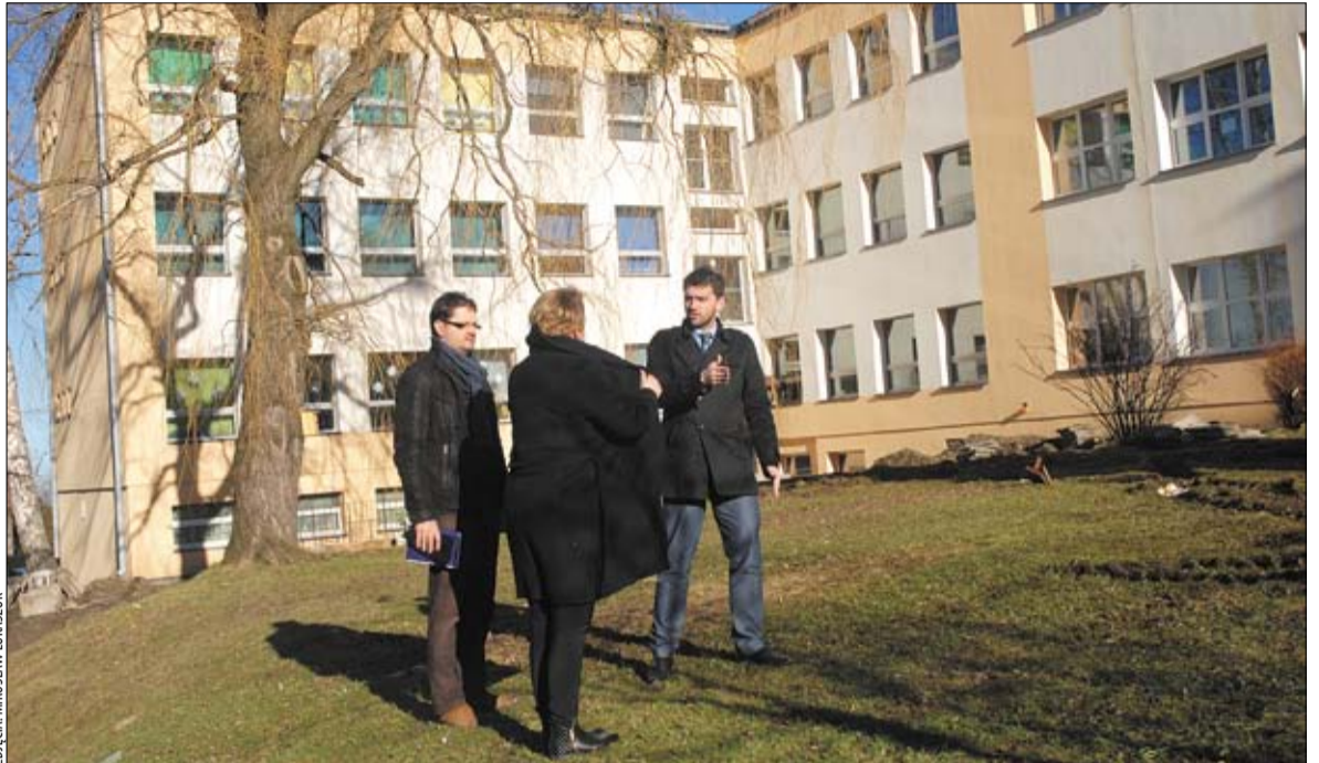
Termomodernizacja Szkoły Podstawowej nr 1 dobiega końca.

Ponadto dokończona zostanie termomodernizacja Szkoły Podstawowej nr 1, przewidziano też przebudowę ul. Lipowej, gminnych dróg i mostów oraz istniejących lokali socjalnych. W zakresie kultury fizycznej i sportu na uwagę zasługuje stworzenie w pobliżu tężni zdrojowej infrastruktury