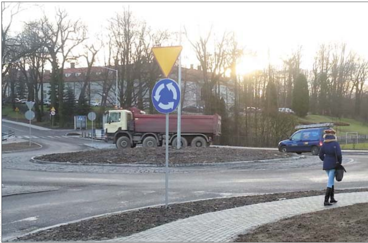
Nowe rondo usprawniło przejazd przez centrum Bestwiny.

Inwestycja ściśle powiązana była z przebudową dłuższego, ponad 1,5-kilometrowego odcinka ulicy Krakowskiej w ramach tzw. schetyńówek, a więc Narodowego Programu Przebudowy Dróg Lokalnych. Wniosek złożony został w tym przypadku przez bielskie Starostwo Powiatowe, administratora drogi, lecz wymagało to dołożenia części kwoty również z budżetu gminy Bestwina. Całość inwestycji wyniosła ponad 5 mln zł, z