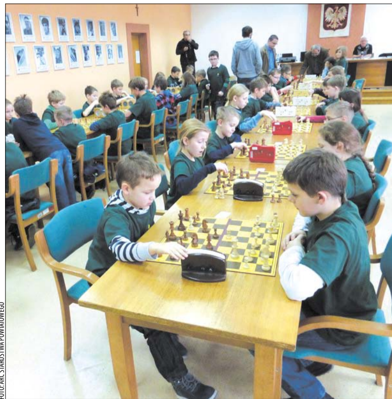
Turniej w bielskim Starostwie Powiatowym zakończył trzecią edycję Powiatowej Ligi Szachowej dla uczniów szkół podstawowych i gimnazjów.