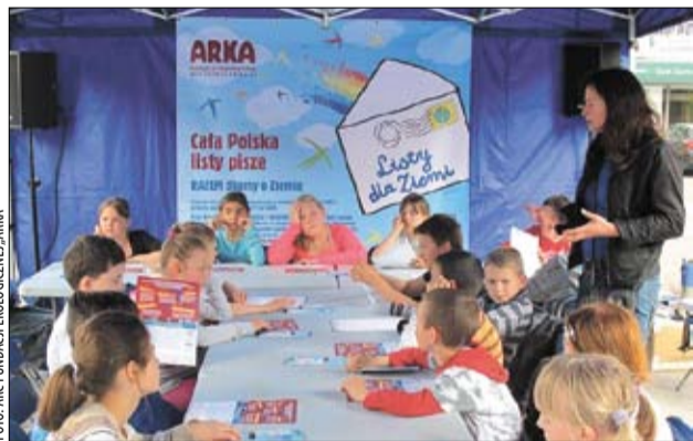
W akcji od początku uczestniczą setki tysięcy uczniów z całej Polski.

Prowadzona od dwóch lat akcja spotyka się z żywym zainteresowaniem polskich gmin. – To dlatego, że doskonale wpisuje się w potrzebę prowadzenia działań edukacyjnych, związanych z tzw. ustawą śmieciową – wyjaśnia Owczarz. W dwóch poprzednich latach akcja „Listy dla Ziemi”, organizowana z inicjatywy Fundacji Ekologicznej „Arka” z Bielska-Białej, objęła 670 samorządów, 7 tys. placówek oświatowych oraz blisko 800 tys. dzieci i młodzieży.