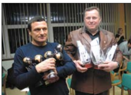
Wiele wyróżnień trafiło do Szkoły Mistrzostwa Sportowego Szczyrk w Buczkowicach.