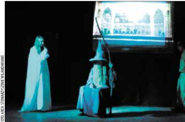
W przedstawieniu „Hobbita” wzięli udział uczniowie miejscowej szkoły.