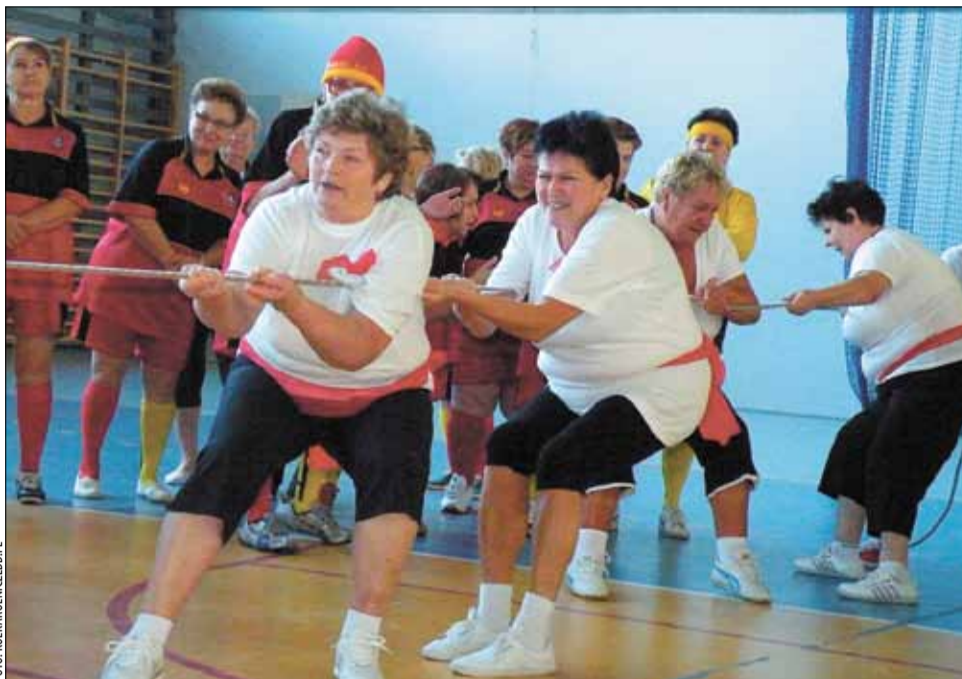
Już od kilku lat panie z KGW późną jesienią mierzą swoje siły podczas spartakiady, organizowanej pod hasłami „Sportowo na wesoło” czy „Zabawy naszych przodków”. To czas na udowodnienie sobie i innym, że panie z KGW nie tylko śpiewają, tańczą i gotują, ale także świetnie ćwiczą i kibicują.

Na Wielkanoc koła organizują przedświąteczne jarmarki i kiermasze, na których królują własnoręcznie wykonane baranki z cukru, mazurki, makowce, czy prześliczne pisanki i inne ozdoby. Z kolei wiosną zespoły regionalne KGW zjadą licznie do Wisły, gdzie 23 i 24 maja w tutejszym amfiteatrze