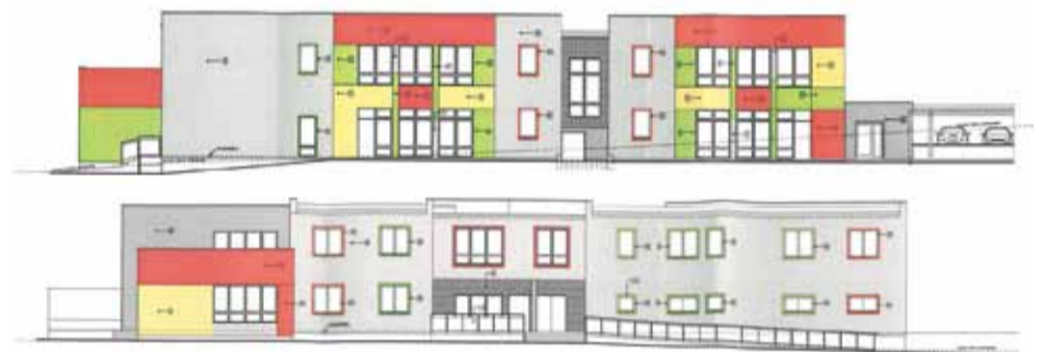
Projekt elewacji południowo-zachodniej i północno-zachodniej przedszkola.

Aktualnie obowiązujący stan prawny, określony przez ustawę o systemie oświaty, obliguje jednostkę samorządu terytorialnego do zapewnienia rocznego przygotowania przedszkolnego dla dzieci 5-letnich. Z dniem 1 września 2015 r. każde dziecko w wieku 4 lat będzie miało prawo do korzystania z wychowania przedszkolnego, a we wrześniu 2017 r. takie prawo uzyskają dzieci już w wieku 3 lat. (MAN)