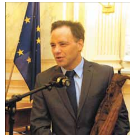
To kolejny Harnaś dla superszybownika Sebastiana Kawy.

cjonariusza spółki akcyjnej TS Podbeskidzie, jako dobrodzieja bielskiego sportu. W tej kategorii nominowane były również firmy: Fiat Auto Poland oraz Bielbet. (MAN)