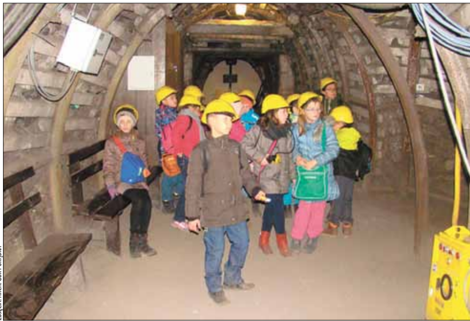
Zwiedzenie sztolni w zabytkowej kopalni to jedna z wielu atrakcji tegorocznych ferii.