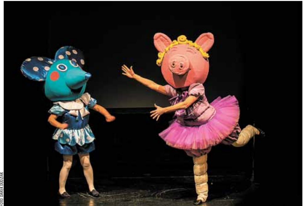
Próba przedstawienia „Bajka o szczęściu”.

We współczesnym świecie odwieczne pytanie „być czy mieć” coraz częściej dotyczy także dzieci. Oczarowane intensywnymi kolorami, atrakcyjną szatą graficzną, czy energicznymi reklamami, popadają w pułapkę złudnej wizji szczęścia, któ-