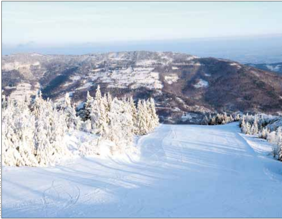
Trasy narciarskie COS-OPO w Szczyrku zostały dobrze przygotowane do sezonu zimowego.

W roku minionym pomyślnie zakończyły się starania o uzyskanie homologacji Międzynarodowej Federacji Narciarskiej (FIS) dla trasy narciarskiej na Skrzycznym. Federacja w dokonanej ocenie brała pod uwagę wiele ważnych kwestii związanych z właściwym i zgodnym z przepisami funkcjonowaniem trasy. – Homologacja, którą uzyskaliście, potwierdza, że jesteście dobrze