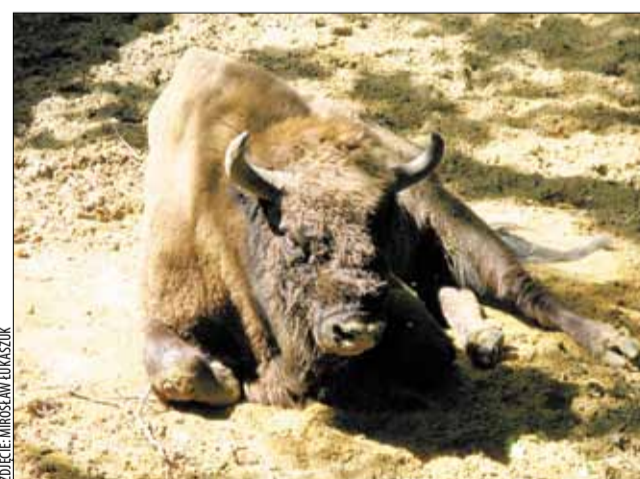
Żubry w Pszczynie stały się wielką atrakcją turystyczną.