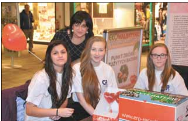
W Czechowicach Walentynki połączone z akcją zbierania zużytych baterii.

Mając na uwadze powyższe wymienione zagrożenia, w róż-