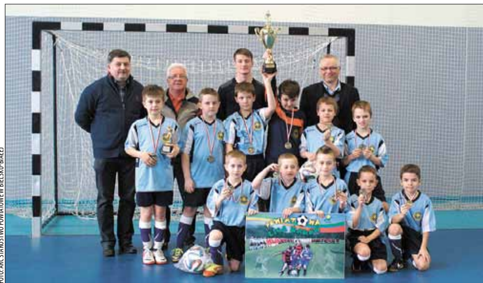
W ubiegłorocznej edycji najlepsi okazali się młodzi piłkarze z Kóz.

Zmagania rozgrywane są systemem „każdy z każdym”, a mecze trwają po 15 minut. Zwycięstwo honorowane jest zdobyciem trzech punktów, w przypadku remisu obie drużyny otrzymują po jednym „oczku”. Za zajęcie pierwszego miejsca w lidze żaków drużyna otrzyma Puchar Starosty Bielskiego oraz sprzęt sportowy, pozostałe zespoły zaś dyplomy i sprzęt. Przewidziano także nagrody indywidualne dla najlepszych zawodników. (MAN)