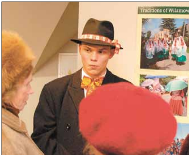
Wydarzeniu towarzyszyła wystawa, prezentująca tradycje Wilamowic.

W towarzystwie naukowych rozważań, regionalnego rękodzieła i przede wszystkim we własnym, wyjątkowym języku w piątek 20 lutego po raz pierwszy obchodzono w Wilamowicach Dzień Języka Ojczystego.