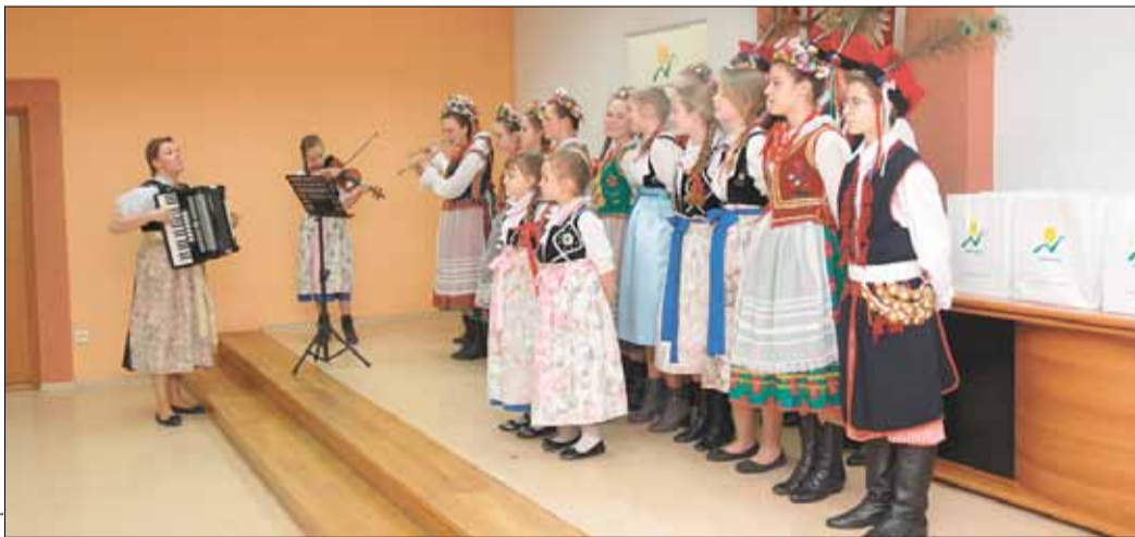
Występ Regionalnego Zespołu Dziecięcego „Dankowanie”