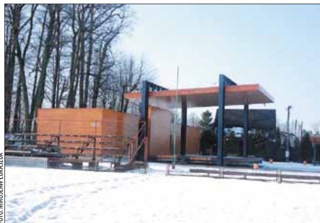
Nowa konstrukcja powstanie obok wybudowanej w ub. roku estrady.

W październiku ub. roku, obok sportowego boiska Pio-