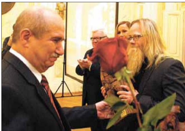
Prezydent Jacek Krywulc zawsze nagradza także dobrodziejów bielskiego sportu.