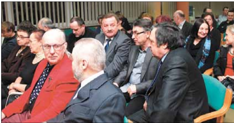
W uroczystości oprócz nagrodzonych twórców wzięli udział także wójtowie gmin Podbeskidzia.